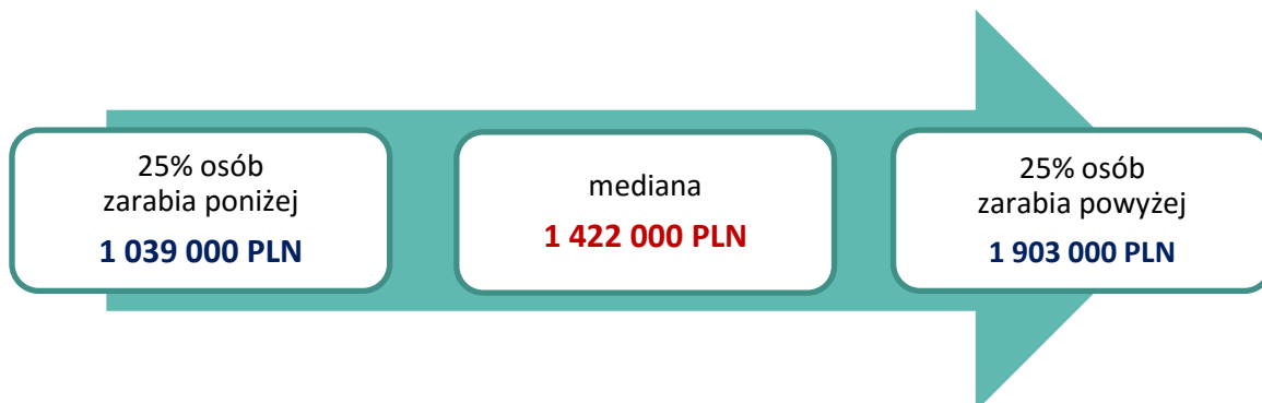
Wykres 1. Roczne wynagrodzenia menedżerów w spółkach w których Skarb Państwa posiada co najmniej 5% akcji (osoby, które przepracowały cały 2015 rok)